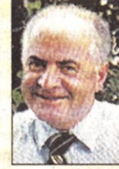
Av. Selami ÖZTÜRK Kadıköy Belediye Başkanı